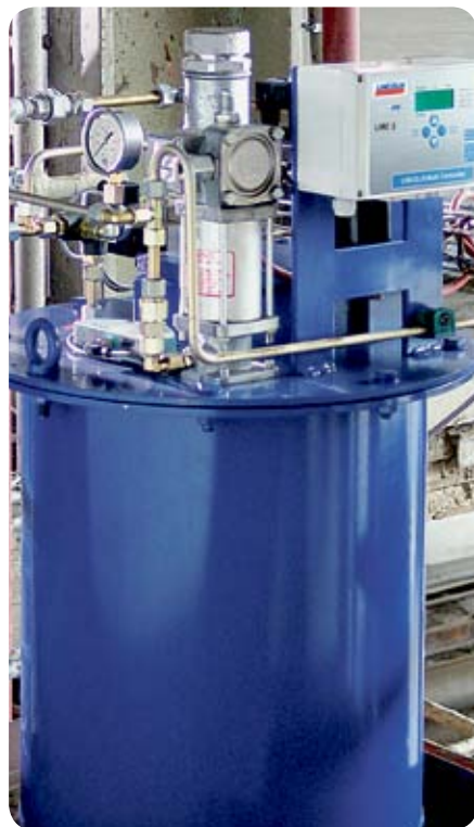
Комплектная насосная станция с системой управления

Насосная станция, включая устройство управления, полностью подсоединена при помощи трубопроводов, так что больше не требуется ручное вмешательство. При этом устраняется опасность возникновения несчастного случая, которая всегда существовала при прежнем методе ручного нанесения смазочного материала. Также значительно уменьшаются затраты времени на техническое обслуживание.